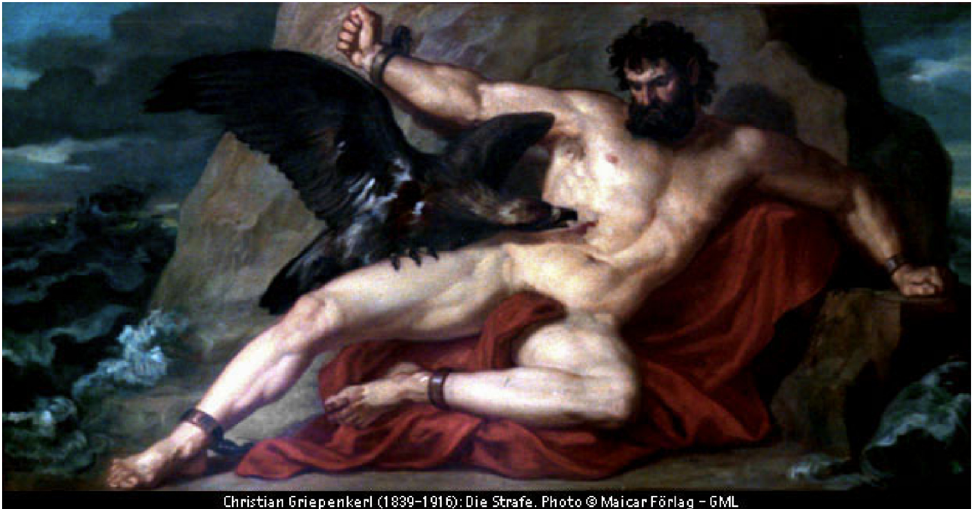
Christian Griepenkerl (1839–1916): Die Strafe.