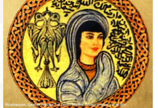
İllustrasyon, Gevher Nesibe Tıp Tarihi Müzesi, prostüründen alınmıştır.

Orta Asya'dan itibaren dönemin kurumlaşmış toplumsal yardımlaşma geleneğinin bir örneği olarak inşa edilen çok sayıda şifahane (bimarhane) ve medrese vardır. Bu şifahanelerde hastalara ücretsiz bakıldığı gibi, o dönem için çok ileri sayılabilecek tekniklerin kullanıldığı bilinmektedir. Ayrıca bu şifahanelerde dönemin büyük hekimleri ve cerrahları tarafından eğitim de verilmektedir.